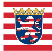
Landesschulamt und Lehrkräfteakademie Staatliches Schulamt für den Landkreis Hersfeld-Rotenburg und den Werra-Meißner-Kreis